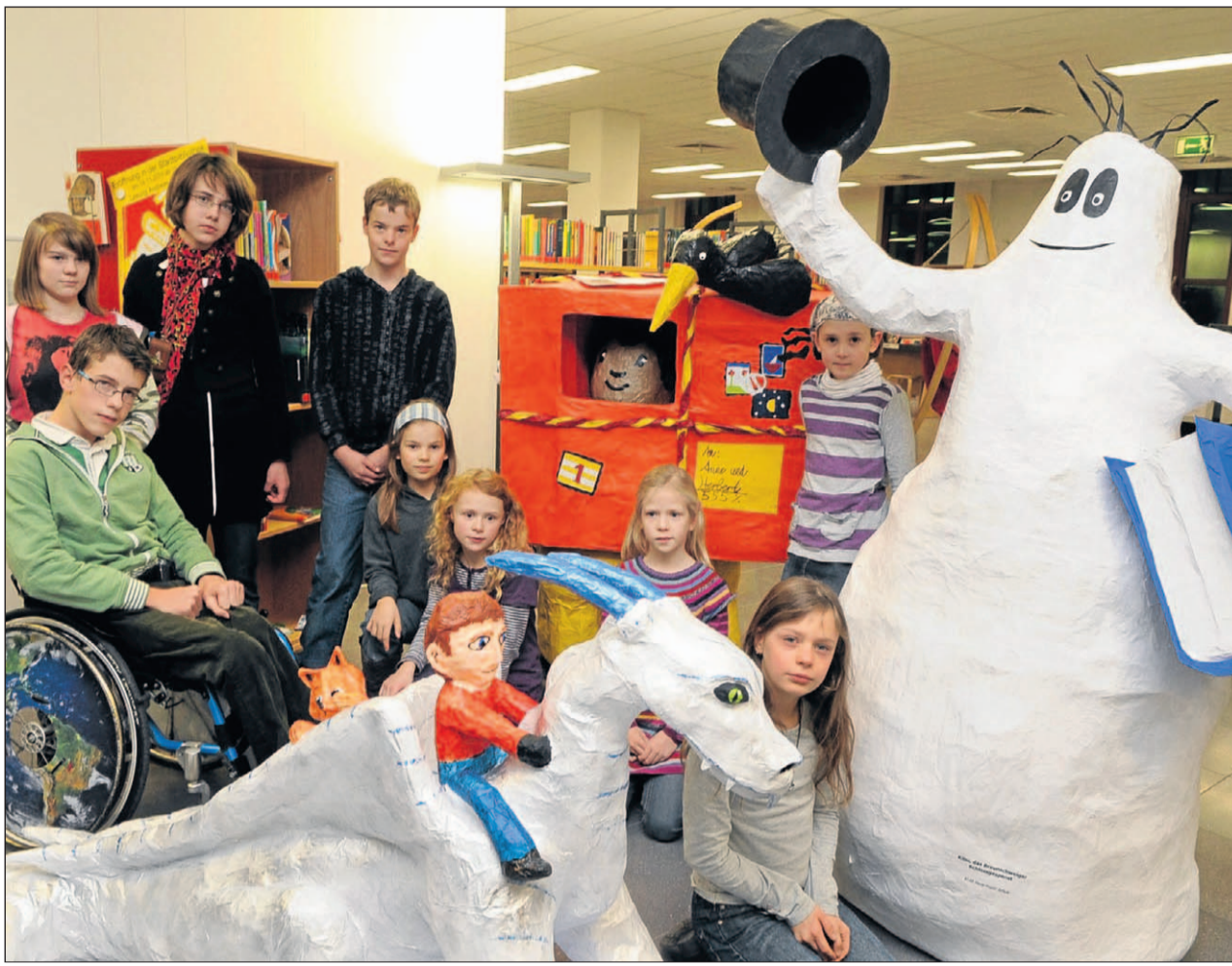
Literarische Figuren – hier der Drachenreiter, Kibu, das Braunschweiger Schlossgespenst, und Bruno – aus Pappmaché: Seit August haben Schüler der Grundschule Klint an Bruno, der sich im Paket selbst verschickt, gearbeitet. Schüler der Hans-Würtz-Schule haben zur Jugendbuchwoche den Drachenreiter erschaffen.